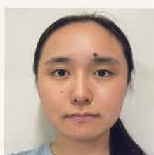
つぐらい あうあ 粒末 楓彩 芸術文化観光専門職大学3年

大阪音楽大学ミュージックコミュニケーション専攻4年生。滋賀県彦根市出身。「持続可能な地域づくり」を目標に、地域コミュニティにおける音楽活動や、プロジェクトの企画、制作について実践的に学んでいる。現在は、学校や家庭以外での子どもの居場所、表現の場づくりに興味を持ち、フリースクールや地域文庫などで、音楽ワークショップの企画、ファシリテーターとしても精力的に活動している。